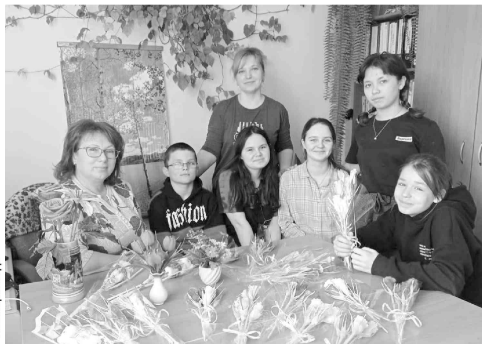
Приятные минуты общения с детьми из подопечных семей