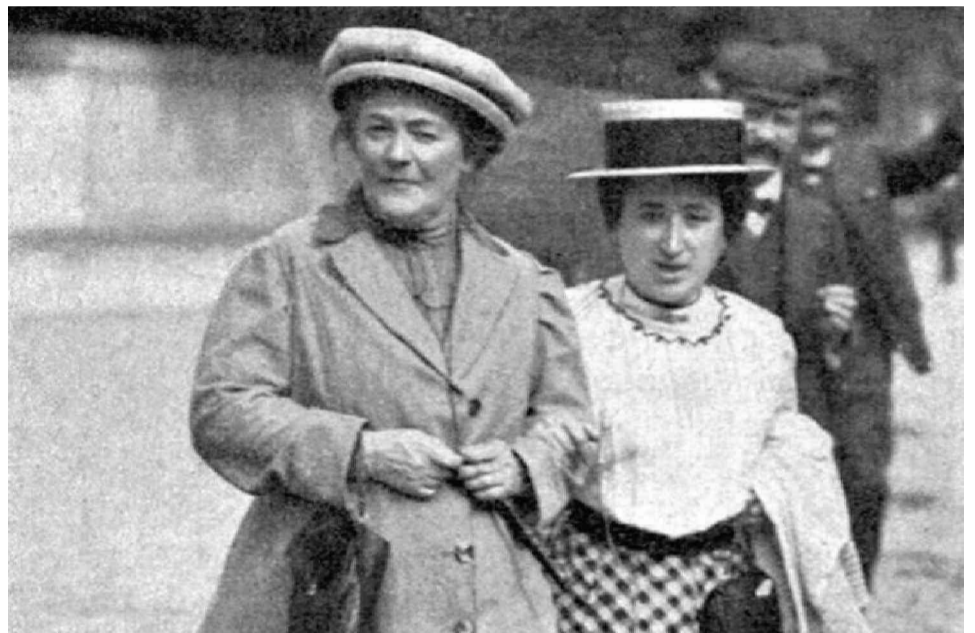
Клара и Роза

Можно биться об заклад, что первая ассоциация, связанная с этим именем, будет такой: «Знаю, она с ещё одной тёткой, Кларой Цеткин, придумала Восьмое марта». Впрочем, возможны варианты в самом широком диапазоне. От оскорбительного «уродка с комплексом неполноценности» до скучнейшего «теоретик марксизма, пропагандирующая революцию и феминизм». Несколько особняком стоит Илья Лагутенко, лидер группы «Мумий Тролль», с прекрасным: «Моя сказка — Роза Люксембург». Пожалуй, такая Роза — самая симпатичная.