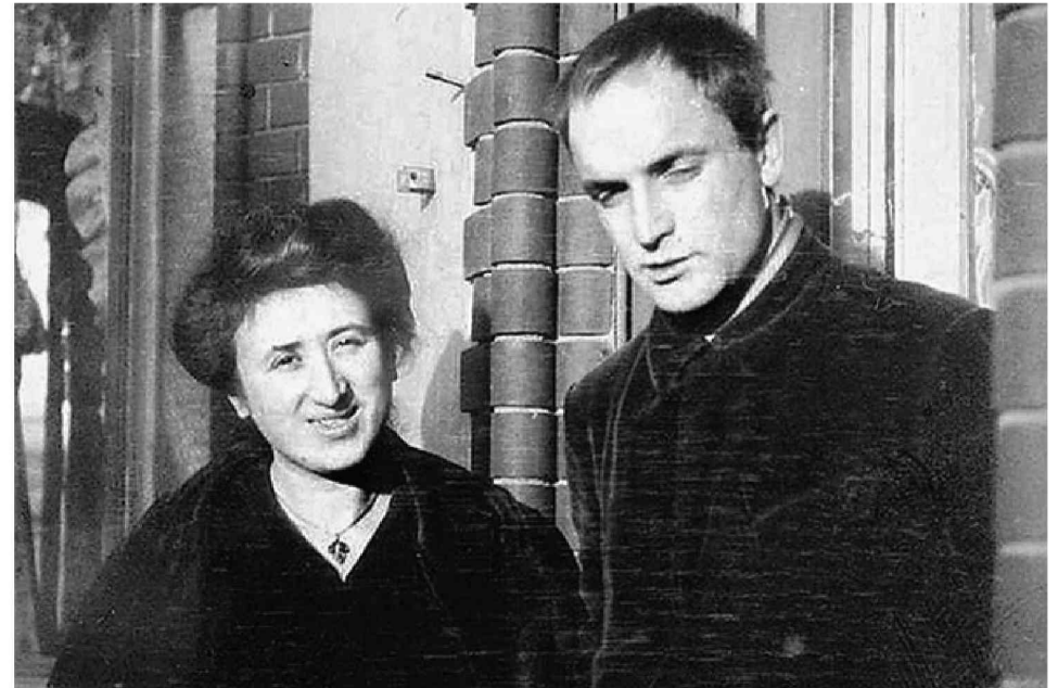
Роза Люксембург и Константин Цеткин