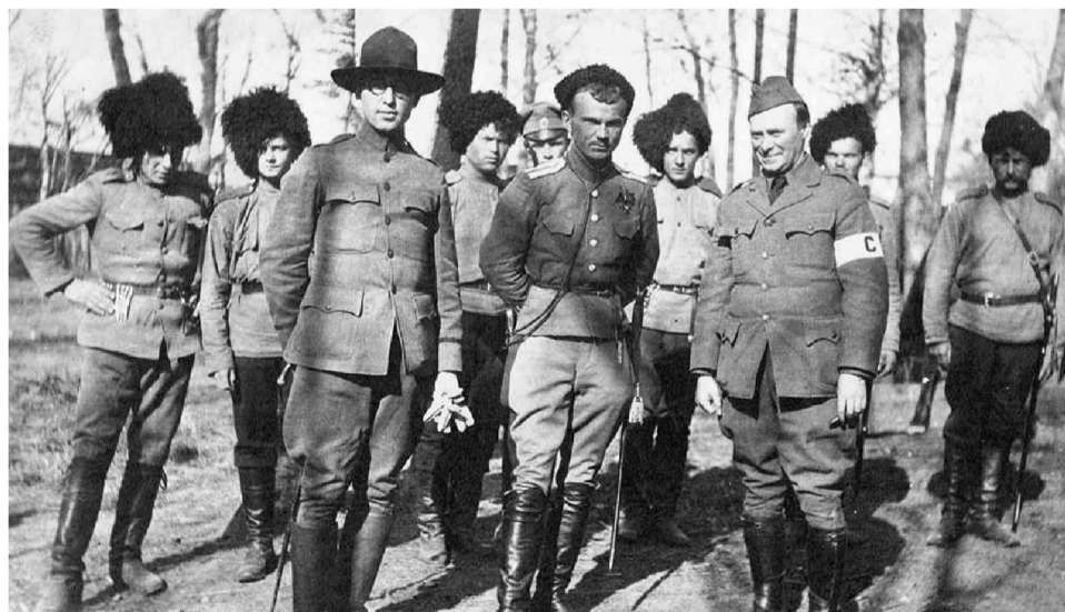
Атаман (в центре) со своими заокеанскими покровителями