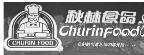
Churin Food, современная торговая марка КНР