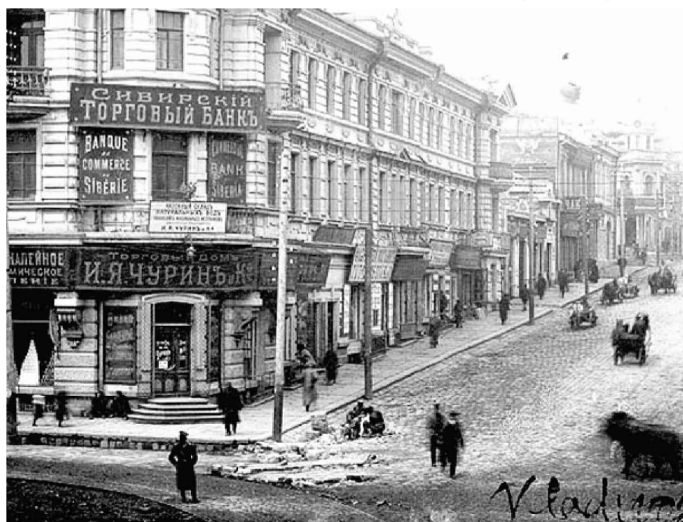
Торговый дом «И.Я. Чуринов и Ко» во Владивостоке