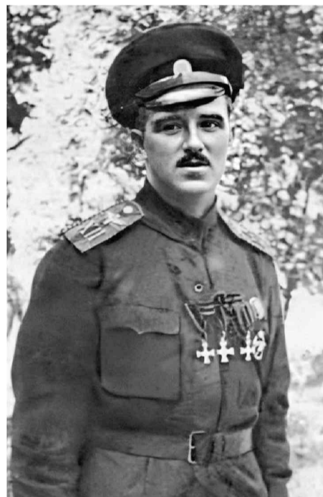
Скоро в путь!

Дальневосточник первым в истории обогнул на велосипеде земной шар!