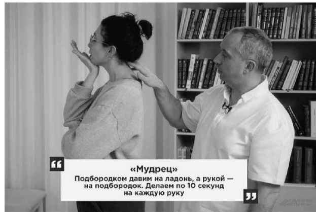
«Мудрец» Подбородком давим на ладонь, а рукой — на подбородок. Делаем по 10 секунд на каждую руку

Упражнение «Взгляд в сторону». Сложите ладони перед собой в области живота, локти при этом немного согнуты. Поверните голову влево, подбородком потянитесь к плечу, и дотроньтесь до него, надавливая на ладони. Если не дотягиваетесь, подведите плечо к под-