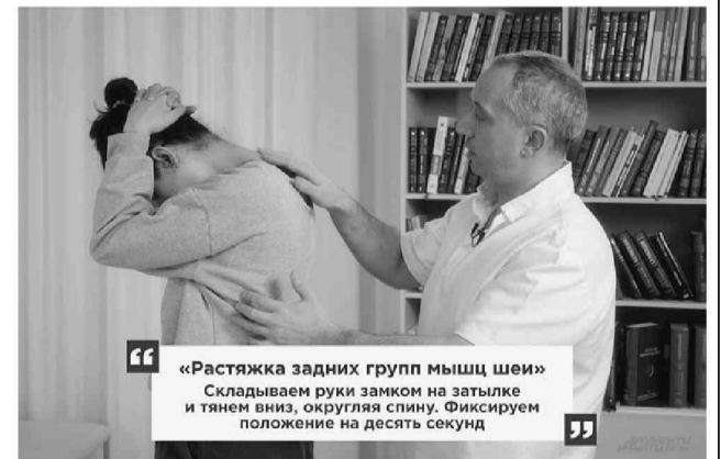
«Растяжка задних групп мышц шеи» Складываем руки замком на затылке и тянем вниз, округляя спину. Фиксируем положение на десять секунд

те снизу левой рукой правый локоть. Подбородком надавите на ладонь, а рукой надавите на подбородок. Вы должны почувствовать, что шея растягивается. Зафиксируйте на десять секунд, после чего поменяйте руки.