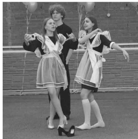
Прощание с детством, школой...