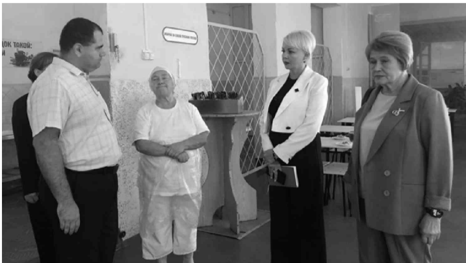
Фото и текст Анастасии Рубановой, пресс-служба администрации ПМО

В этот день также проверен школьный спортзал и спортивный инвентарь. Во время инспектирования замглавы обратила внимание на отсутствие на прилегающей к школе территории благоустроенной спортивной площадки. В перспективе будет рассмотрен вопрос строительства современного стадиона.