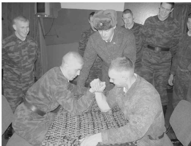
В минуты отдыха