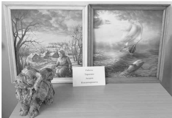
Картины и скульптура А.В.Тарасова

Лариса ПАЗДНИКОВА.